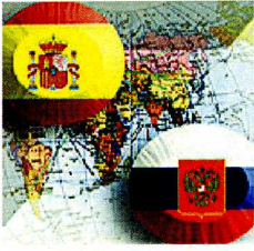
Перекрестный год России и Испании