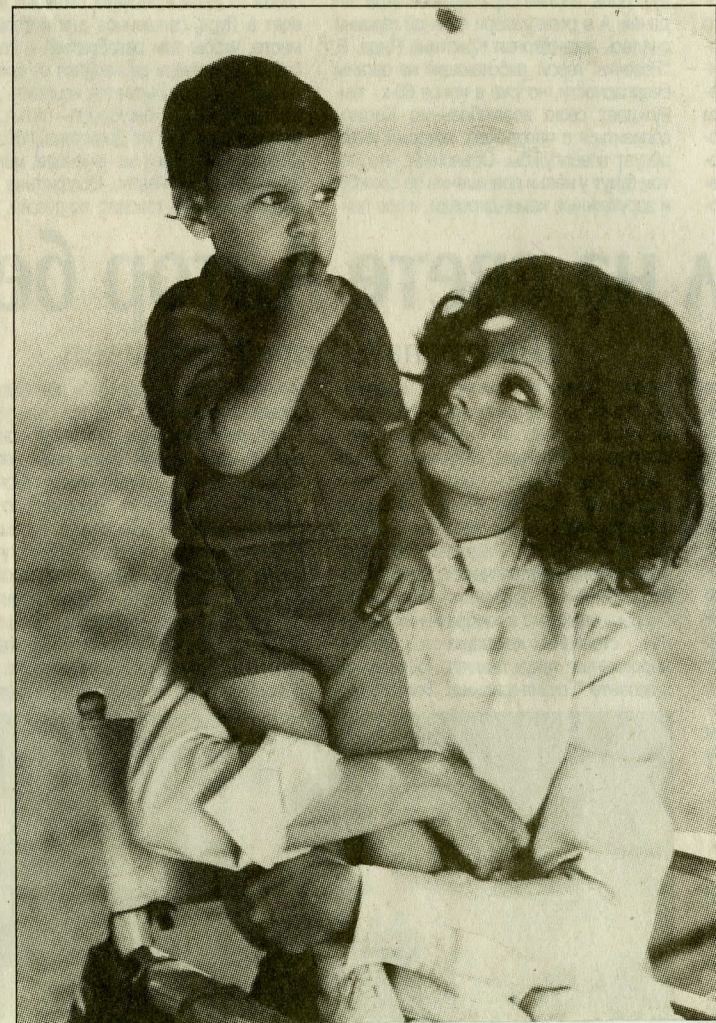
Слева: М.Мастрояни. Справа: С.Лорен с сыном. Из серии "Частная жизнь Софи Лорен"