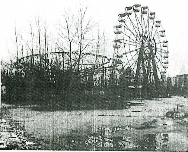
Photo extraite de la série «Walk to the Future», de Sergueï Chestakov. S. CHESTAKOV